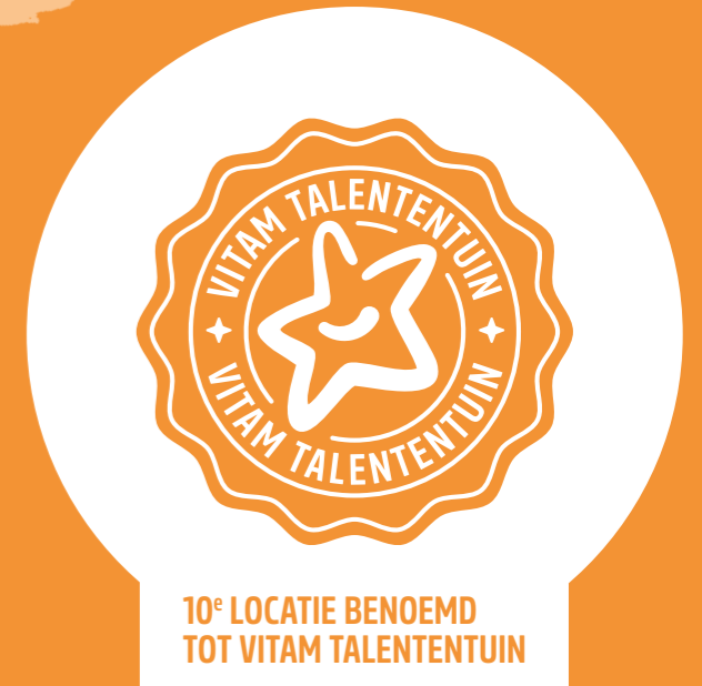
10 e LOCATIE BENOEMD TOT VITAM TALENTENTUIN