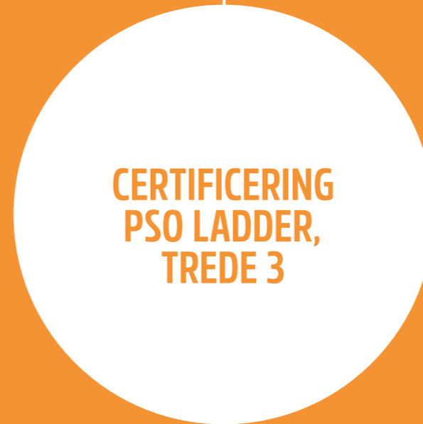
CERTIFICERING PSO LADDER, TREDE 3