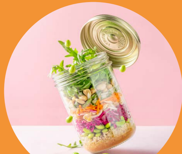
INTRODUCTIE FOODMODULE POTJE GELUK