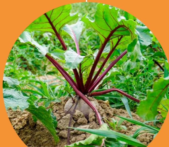
START UITROL VAN DE EERSTE VITAM-LOCATIES OP DE KORTE KETENS VAN BOERSCHAPPEN