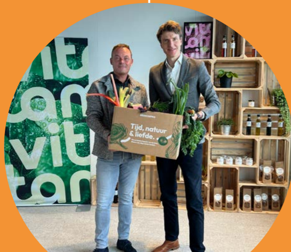
ONDERTEKENING SAMENWERKING GROOTHANDEL BOERSCHAPPEN