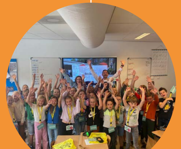
1.500 e GROENTEHELD UITGEROEPEN DOOR STICHTING VITAM DOET GOED